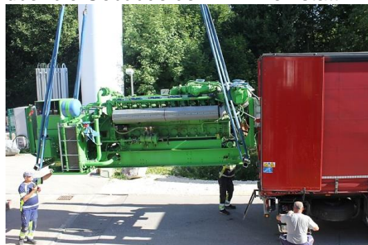
Verladen auf LKW