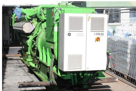
Die ausgebaute Anlage vor der Energiezentrale