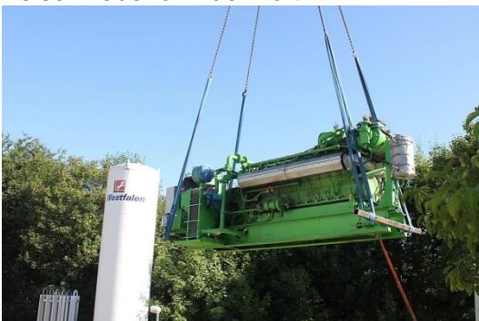
Einschwenken der Anlage