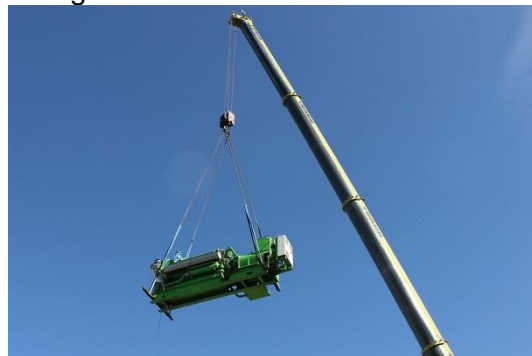
Ein großer Autokran im Einsatz