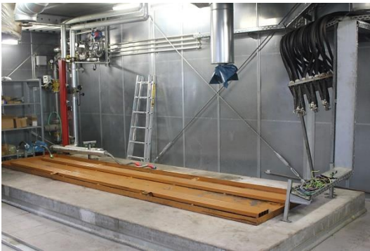
Der leere Generatorraum im BHKW