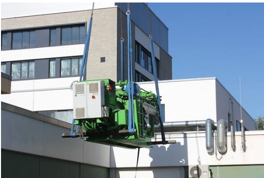
Das mehrere Tonnen schwere System am Haken